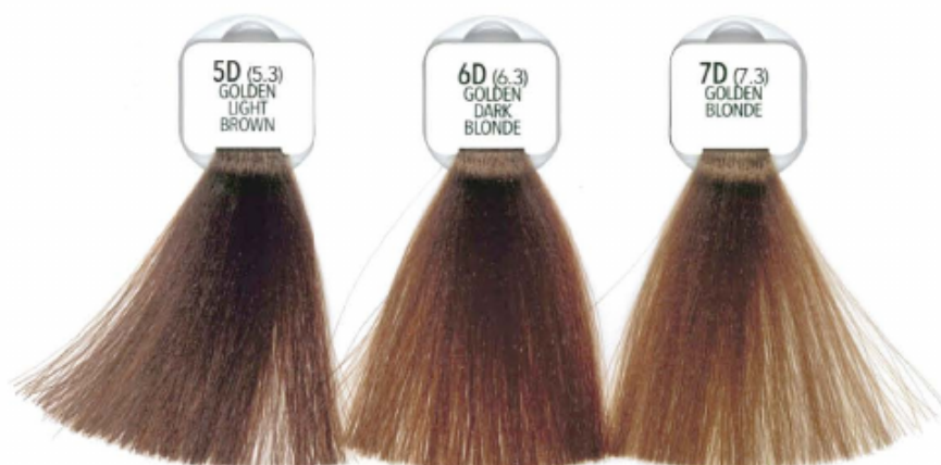
5D (5.3) GOLDEN LIGHT BROWN CASTANO CHIARO DORATO CASTAÑO CLARO DORADO CHÂTAÏN CLAIR DORÉ CASTANHO-CLARO DOURADO ZŁOCISTY JASNY BRĄZ SVĚTLĚ HNĚDÁ ZLATÁ HELL GOLDBRAUN GOLD LICHTBRAUN KASTANO ANKHO NTOPE СВЕТЛО-КАСТАНОВЫЙ ЗОЛОТИСТЫЙ 淡金褐 قهوه ای طلایی روشن ذهبی بتی فاتح

DORATI DORADOS DORÉS DOURADOS ZŁOCISTE ZLATÁ GOLD GOLD NTOPE ЗОЛОТИСТЫЕ 金色調 طلایی ذهبی