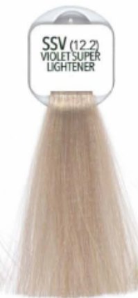
SSV (12.2) VIOLET SUPER LIGHTENER SUPERSCHÄRENTE VIOLETA SUPERACLARANTE VIOLETA SUPER-ÉCLAIRCISANT VIOLETA SUPER-ACLARANTE VIOLETA EKSTRA JASNY FIOLETOWY SUPERBLOND FIALOWA VIOLETT SUPER AUFHELLER VIOLETT SUPER LIGHTENER ΥΠΕΡΑΝΘΙΣΤΙΚΟ ΒΙΟΛΕ СУПЕРБЛОНДИН ОМОКРЕТОВАЯ 淡晶紫

روشن کننده بسیار قوی خاکستری تفتیح رمادی قائق