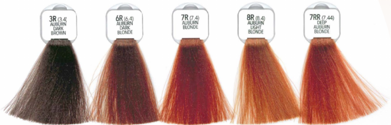
3R (3.4) AUBURN DARK BROWN

BIONDO CHIARO RAME DORATO RUBIO CLARO COBRE DORADO BLOND CLAIR CUIVRE DORE L'OURO CLARO COBRE DOURADO MIEDZIANO-ZŁOCISTY JASNY BLOND ZŁATA MEDÉNA SVĚTLÁ BLOND KUPFER-GOLD HELLBLOND GOLD ROODBRUIN LICHTBLOND ΞΑΝΘΟ ΑΝΚΙΣΤΟ ΠΥΡΕΑΝΘ ΚΥΡΕ БЛОНДИНЪ СВЕТЛЫЙ МЕДНО-ЗОЛОТИСТЫЙ 金棕淺棕 بلوند مسی طلایی روشن ذهبی بنی محمر اشقر فاتح