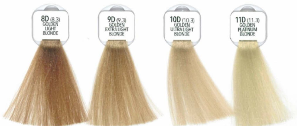
8D (8.3) GOLDEN LIGHT BLONDE BIONDO CHIARO DORATO RUBIO CLARO DORADO BLOND CLAIR DORÉ LOURO CLARO DOURADO ZŁOCISTY JASNY BLOND SVĚTLĚ ZLATÁ BLOND HELL GOLDBLOND GOLD LICHTBLOND FANBO ANKHO NTOPE БЛОНДИН СВЕТЛЫЙ ЗОЛОТИСТЫЙ 淡金黃褐