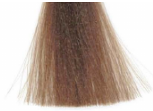
8 TOBACCO TABACCO - TABACCO TABAC - TABAC TABAKOWY - TABAK TABAK - TABAK TOBACCO - TABAK 菸草粉 تنباکوی تبخ