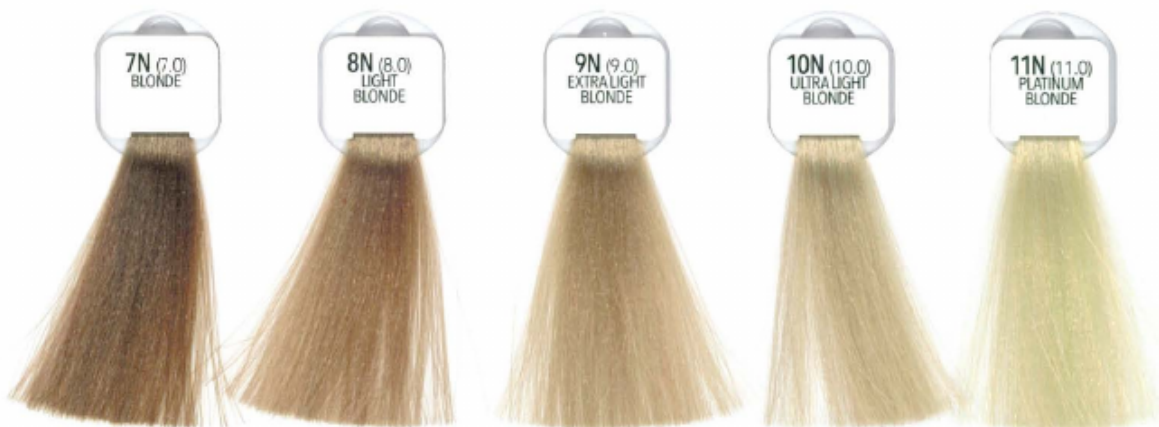
7N (7.0) BLONDE BIONDO - RUBIO BLOND - LOURO BLOND - STRENN BLOND BLOND - BLOND ЗАНДО БЛОНДИН 黄金色 بلوند أشقر