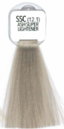
SSC (12.1) ASH SUPER LIGHTENER SUPERSCHÄRENTE CENDRE SUPERACLARANTE CENDRE SUPER-ÉCLAIRCISANT CENDRE SUPER-ACLARANTE CINZA EKSTRA JASNY POPELANY SUPERBLOND POPELANIA ASH SUPER AUFHELLER AS SUPER LIGHTENER ΥΠΕΡΑΝΘΙΣΤΙΚΟ ΣΑΝΤΙΡΕ СУПЕРБЛОНДИН ПЕТЕЛЬНЫЙ 特淺銀灰

روشن کننده بسیار قوی طبیعی تفتیح طبیعی قائق