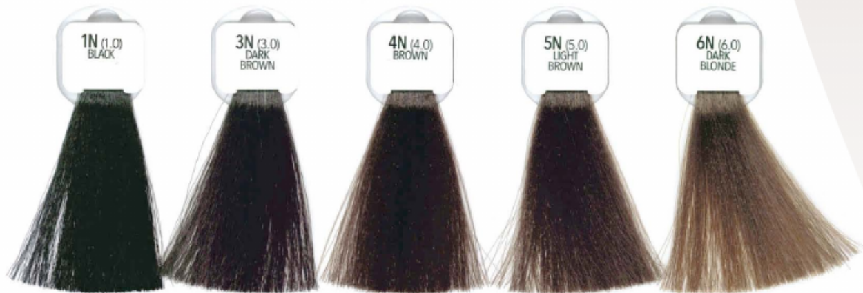
1N (1.0) BLACK NERO - NEGRO NOIR - PRETO CZARNY - ČERNÁ SCHWARZ - ZWART МАРО - ЧЕРНЫЙ 自然黒 مشكى طبيعي أسود

NATURAL NATURALI NATURELES NATURELS NATURALIS NATURALNE PŘÍRODNÍ NATURTON NATUURLUK ΦΥΣΙΚΑ НАТУРАЛЬНЫЕ 基色调 طبيعي طبيعي