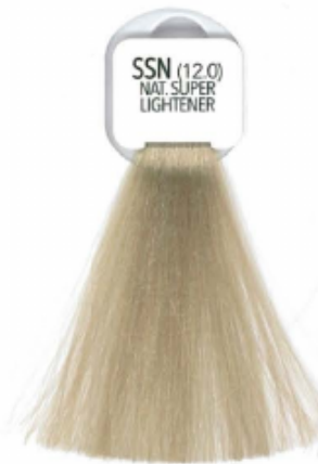
SSN (12.0) NAT SUPER LIGHTENER SUPERSCHÄRENTE NATURALE SUPERACLARANTE NATUREL SUPER-ÉCLAIRCISANT NATUREL SUPER-ACLARANTE NATUREL EKSTRA JASNY NATURALNY PRÉCISÉ SUPERBLOND NATURAL SUPER AUFHELLER NATUREL SUPER LIGHTENER ΥΠΕΡΑΝΘΙΣΤΙΚΟ ΦΥΣΙΚΟ СУПЕРБЛОНДИН НАТУРАЛЬНЫЙ 特淺金黃

SUPERSCHÄRENTE SUPERACLARANTES SUPER-ÉCLAIRCISANTS SUPER-ACLARANTES SUPER ROZJAŚNIAJĄCE SUPER BLOND AUFHELLER SUPER LIGHTENERS ΥΠΕΡΑΝΘΙΣΤΙΚΑ СУПЕРБЛОНДИНЫ 極淺色調 روشن کننده ها تفتیح