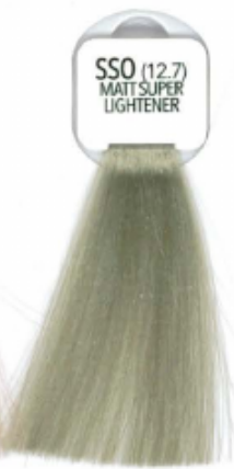
SSO (12.7) MATT SUPER LIGHTENER SUPERSCHÄRENTE MATT SUPERACLARANTE MATT SUPER-ÉCLAIRCISANT MATT SUPER-ACLARANTE MATT EKSTRA JASNY OLJOWY SUPERBLOND MATNA SUPER AUFHELLER MATT MAT SUPER LIGHTENER ΥΠΕΡΑΝΘΙΣΤΙΚΟ ΜΑΤ СУПЕРБЛОНДИН МАТОВАЯ 特淺灰金

روشن کننده بسیار قوی بادبازی تفتیح بنفسجی قائق