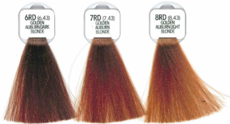
6RD (6.43) GOLDEN AUBURN DARK BLONDE

RAMATI COBRIZOS CUIVRÉS ACOBREADOS MIEDZIANE MEDÉNA KUPFER ROODBRUIN ΠΥΡΕΑΝΘ МЕДНЫЕ 紅褐色調 مسی بني محمر