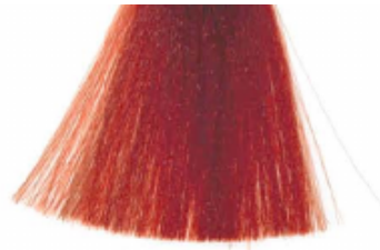
7 FLAME FLUCKO - RUEGO FEU - FOGO OGNISTY - OHNIVĚ, ČERVENÁ FELER - VUURROOD ОГОНЬ - ОГОНИ شعله آتش أحمر