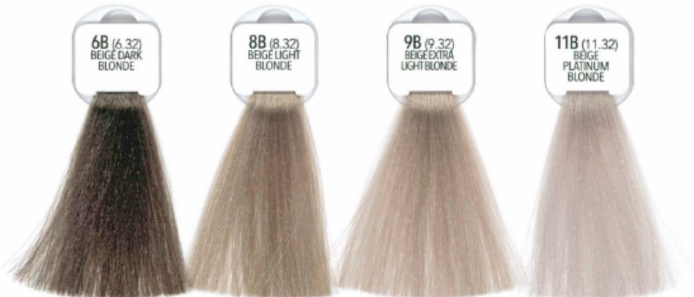
6B (6.32) BEIGE DARK BLONDE BIONDO SCURO BEIGE RUBIO OSCURO BEIGE BLOND FONCE BEIGE LOURO ESCURO BEIGE BEZOVY TEMNY BLOND TMANÁ BLOND BEŽOVÁ DUNKEL BEIGEBLOND BEIGE DONKERBLOND =ANBO SKOPRO MIEZ БЛОНДИН ТЕМНЫЙ БЕЖЕВЫЙ 金栗色 بلوند شکلاتی تیره بيج أشقر غامق